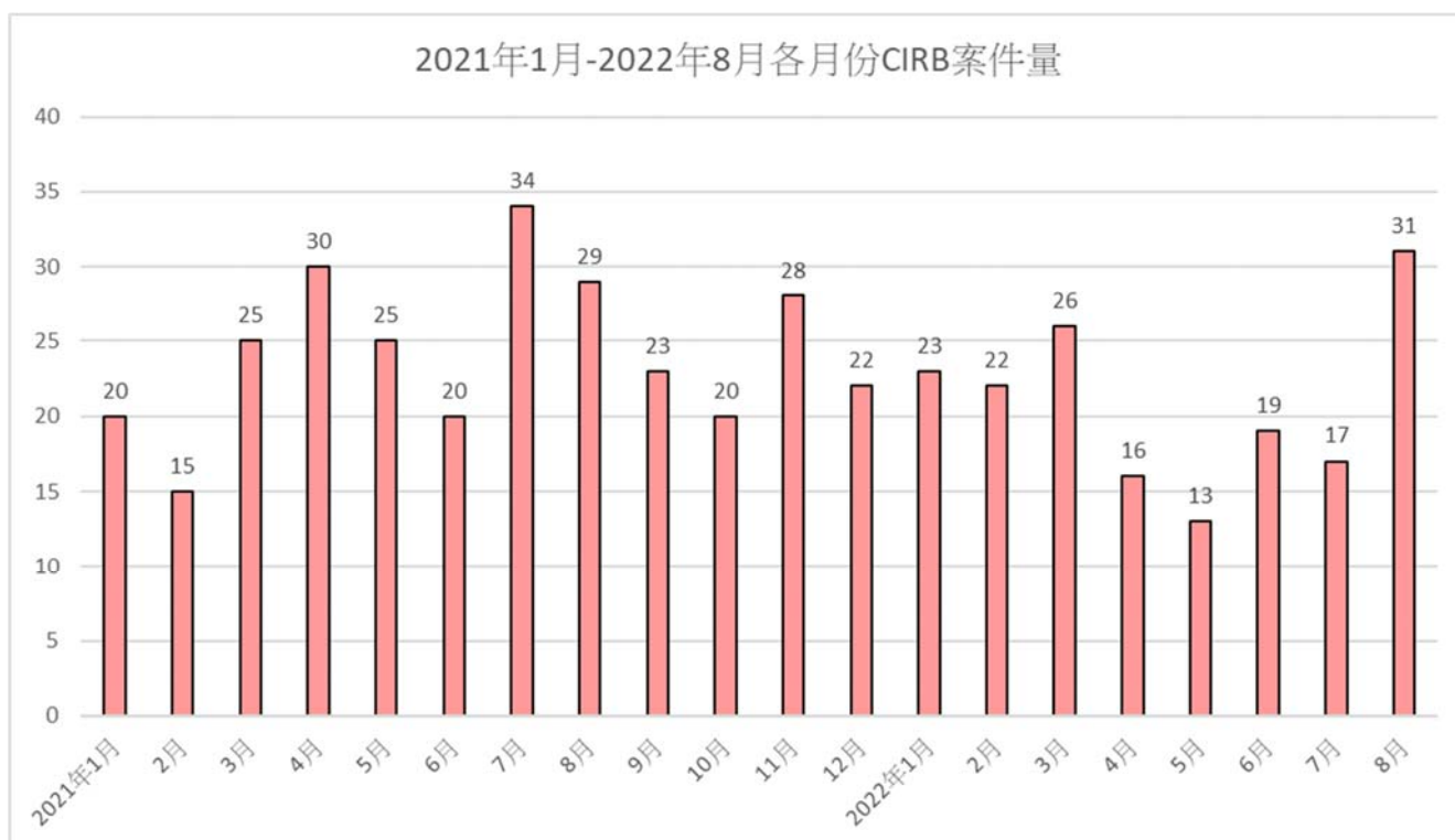
2021年1月-2022年8月各月份CIRB案件量